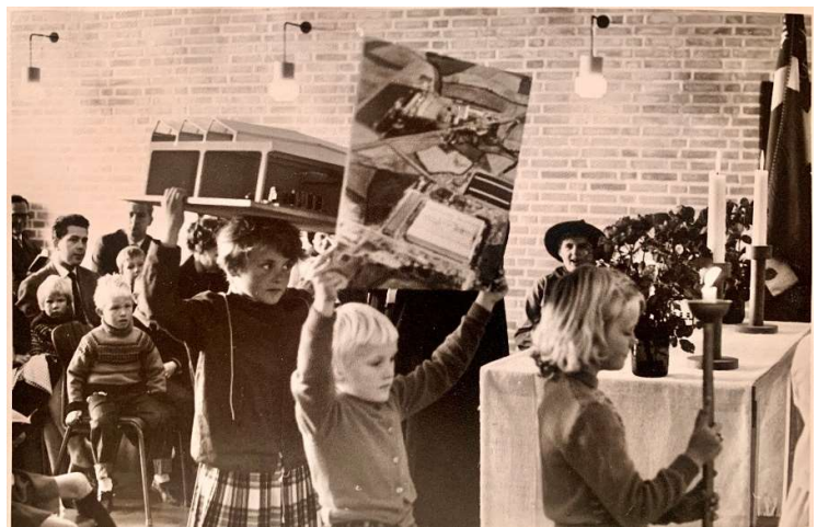
Høstgudstjeneste på Langesø skole i 1964, hvor Guds gaver placeres på alteret.